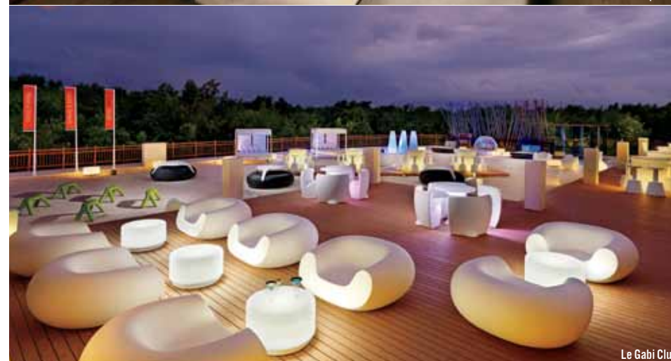
Le Gabi Club