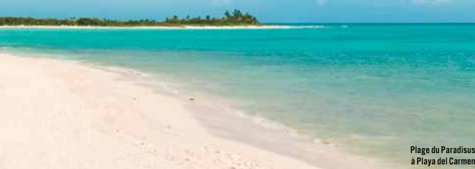
Plage du Paradisus à Playa del Carmen

La clé du paradis Après ma première journée remplie de moments wow, je pars à la découverte des lieux. Le Paradisus est construit en deux parties: La Perla, la section destinée aux adultes, et La Esmeralda, où sont logées les familles. Reliées par une zone commune (El Zocalo), elles offrent le même service de qualité. En mangeant mon petit-déjeuner sur la terrasse ombragée du restaurant La Palapa, je prends conscience que la clé pour jouir pleinement de mon séjour, c'est d'arriver à décrocher. Impossible de savourer pleinement mon délicieux smoothie à la banane et au lait de soya si je pense à ce qui se passe à la maison ou au bureau. Je décide donc de mettre mes préoccupations de côté et d'apprécier ce qui m'entoure. Et les plaisirs abondent. J'admire les fleurs et la mangrove – gardée intacte par souci écologique – sur le sentier en bois qui mène à la plage privée. Je peux non seulement y choisir l'emplacement de ma chaise longue, mais aussi le revêtement (tissu ou plastique) et le type de siège (droit ou incliné). Il y a même des lits à baldaquin blancs. Le confort à géométrie variable! En longeant le bord de la mer, je constate que la plage du côté de La Esmeralda est plus belle, plus large, et je m'y installe. Au retour de la baignade, je m'allonge sur les coussins des palapas , de petites huttes au toit en feuilles de palmier séchées. Je me rends compte que tout est conçu pour le bien-être maximal des clients. Et si je prenais un pina colada, pour changer?