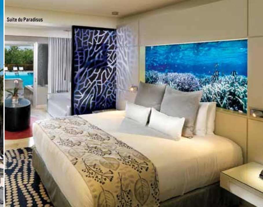
Suite du Paradisus

C'est vous la reine! Après vous être extasiée sur le parfum des savons et l'orchidée placée sur la table à café, le premier défi quand vous prenez possession d'une chambre dans un resort de luxe cinq-étoiles, option Service royal, c'est de comprendre à quoi servent les nombreux interrupteurs. Vous avez écouté l'exposé qu'on vous a fait au préalable, mais à cause du manque de sommeil, vous avez l'esprit embrouillé... C'est d'ailleurs la raison pour laquelle vous ne vous précipitez pas sur les bouteilles format maxi du minibar bien garni. Vous préférez défaire votre valise. Il y a tellement d'espace de rangement que vous n'êtes même pas obligée d'empiler vos t-shirts, vous pouvez les placer les uns à côté des autres dans les tiroirs. Votre second défi consiste à occuper votre majordome personnel, sans cesse relié à vous par un cellulaire. Comme vous êtes une femme autonome, vous n'avez pas l'habitude de vous faire servir. Il vous faudra donc un certain temps pour lui trouver des tâches: vous apporter une margarita sur la plage, dénicher une petite pochette pour votre monnaie ou, plus difficile, faire couler un bain à la bonne température au moment où vous entrez dans votre chambre le soir. Bain dans lequel, sans que vous le demandiez, il aura eu la délicatesse d'ajouter quelques pétales de rose... ▷