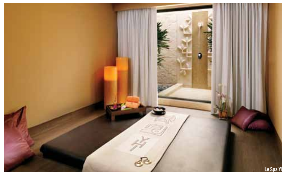
Le Spa Yhi

Gastronomie incluse Franchement, je ne pensais pas trouver dans un tout compris mexicain une telle variété de propositions culinaires. Pensez-y, il y a 14 restaurants différents au Paradisus! On veut déguster de la cuisine gastronomique? On se dirige vers le Passion , le plus coté, dont les mets exquis (caramel au homard, hmm...) sont préparés par le chef Martin Berasategui (sept étoiles Michelin). Une envie de sushis? On va au Bana . Pour la côte de bœuf, il y a The Grill . Des spécialités mexicaines, comme le céviche? Rien ne vaut le Mole . J'ai particulièrement aimé le Vento et sa cuisine raffinée d'inspiration libanaise et maghrébine. J'ai même participé à une dégustation de tequila à un des huit bars à la décoration très in. Certaines variétés haut de gamme de cette eau-de vie d'agave ont une belle couleur ambrée et un goût de cognac. Qui l'aurait cru?